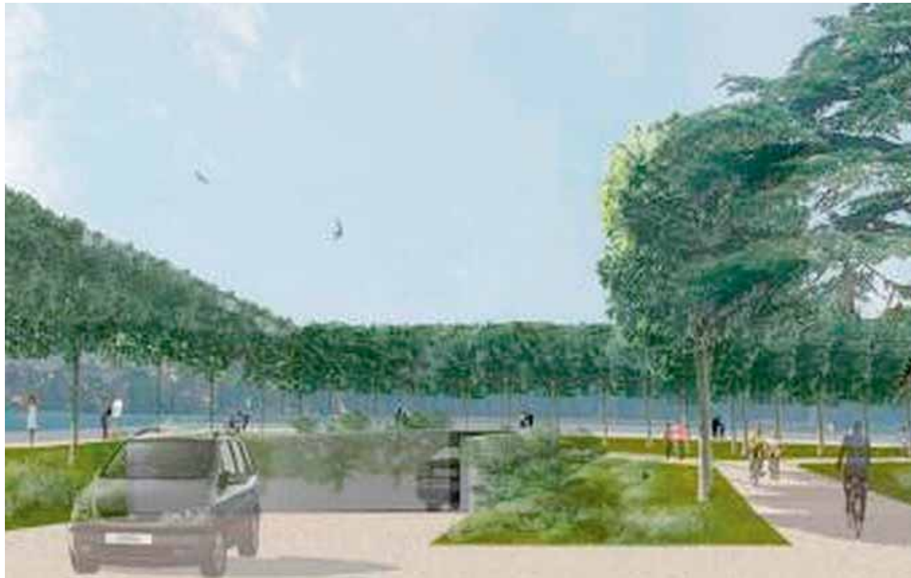
L'entrée du futur parking, image de synthèse.

MORGES • Il y a quelques mois, le syndic de Morges faisait savoir que le projet de parking sous les quais, au programme de la législature, faisait son petit bonhomme de chemin. Où en sommes-nous aujourd'hui?